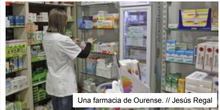
Una farmacia de Ourense.