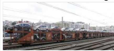
Una vieja demanda de los operadores que mueven vehículos