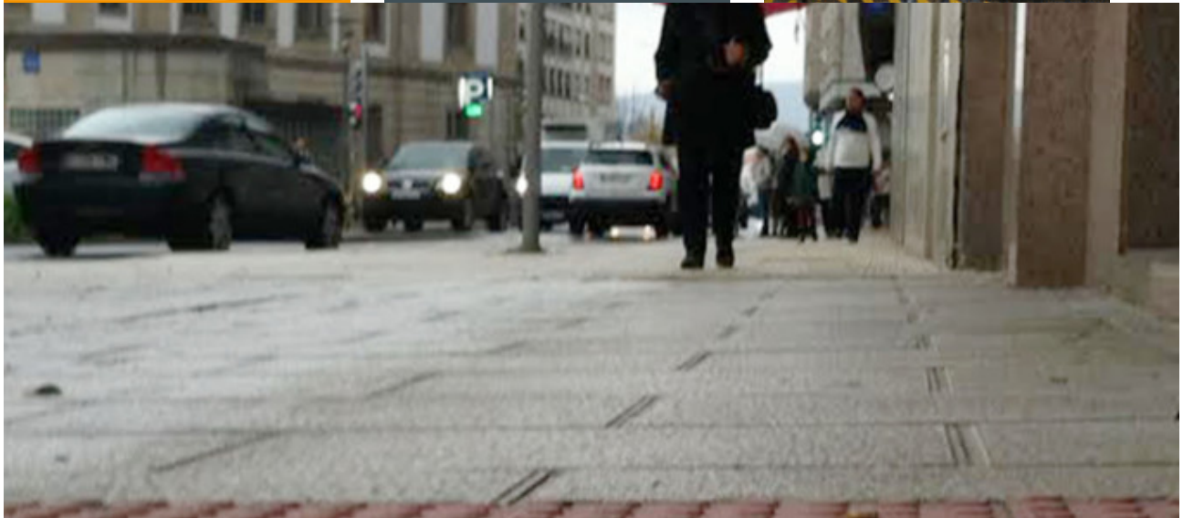
Viario urbano de Pontevedra