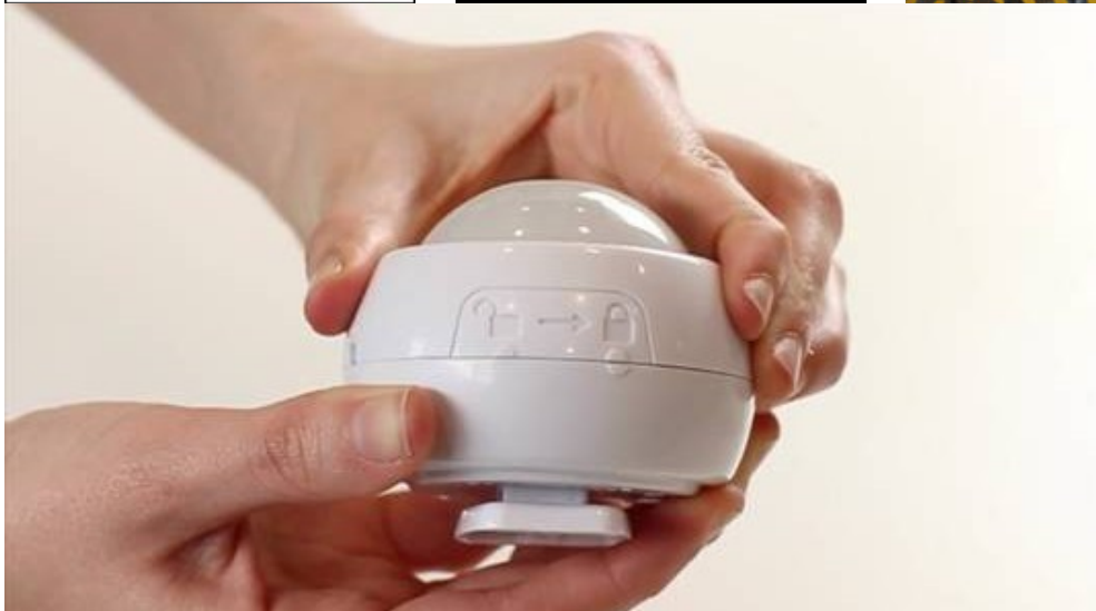
Pequeno sistema domótico de control da enerxía