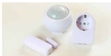
Pequeno sistema domótico de control da enerxía

243 familias pontevedresas solicitaron xa participar na proba piloto de eficiencia enerxética que a Deputación de Pontevedra puxo en marcha no marco do proxecto depoGAP. Esta iniciativa ten como obxectivo sensibilizar á cidadanía do uso eficiente da enerxía nos fogares.