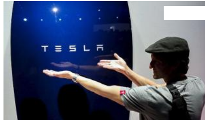
Una batería de Tesla.

El Ministerio de Industria, Energía y Turismo creará un nuevo cargo que desincentivará el uso de baterías o sistemas de almacenamiento por parte de los autoconsumidores de electricidad que se conecten a la red , según se aprecia en el borrador de real decreto que regula esta actividad, cuyo contenido está siendo sometido a consulta pública.